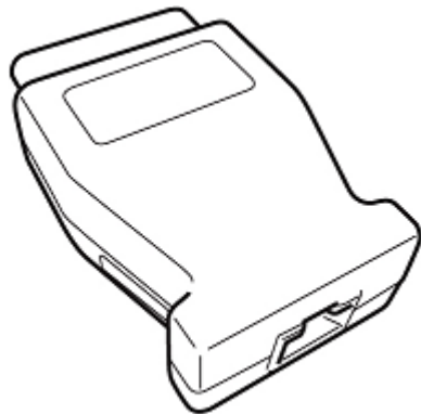
図 2 VOE アダプター