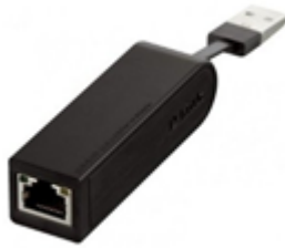
図 3 USB イーサネットアダプター